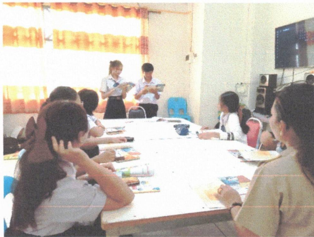
นำเสนอกิจกรรมการเรียนรู้