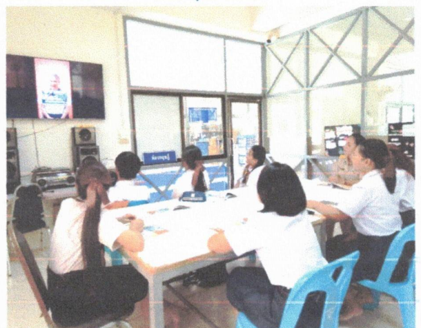
ครูให้นักเรียนดูสื่อการสอนเพื่อให้ผู้เรียนเข้าใจเรื่องที่เรียนมากยิ่งขึ้น