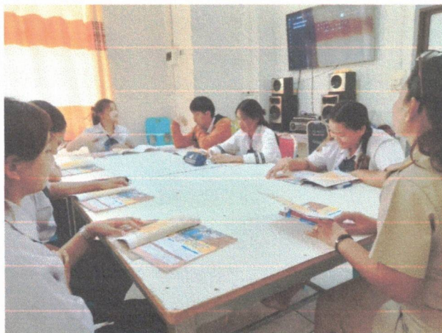
ครูให้นักเรียนทำความเข้าใจหน่วยเรียน