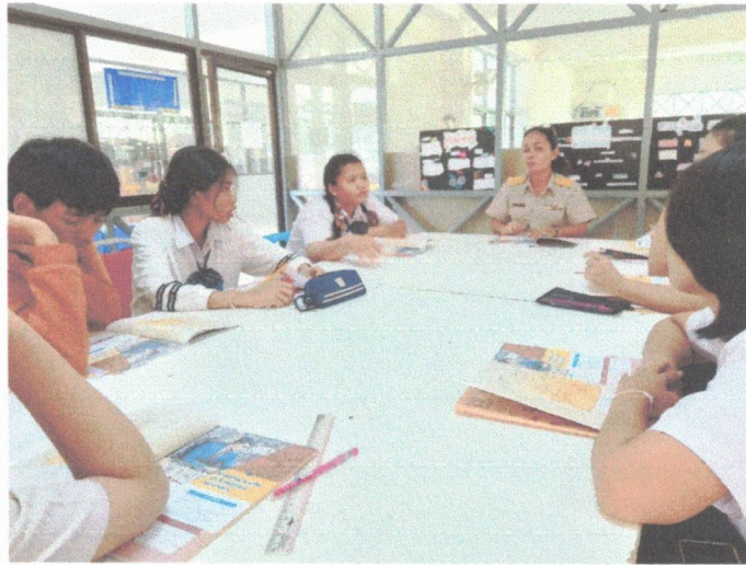
การแจ้งจุดประสงค์การเรียนรู้รายวิชา