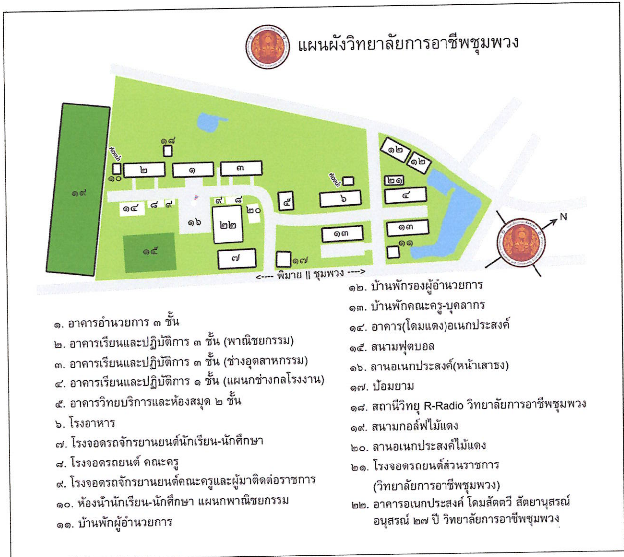
ภาพที่ ๑ : แสดงแผนผังวิทยาลัยการอาชีพชุมพวง

ที่ตั้ง : ถนนพิมาย-ชุมพวง อำเภอชุมพวง จังหวัดนครราชสีมา